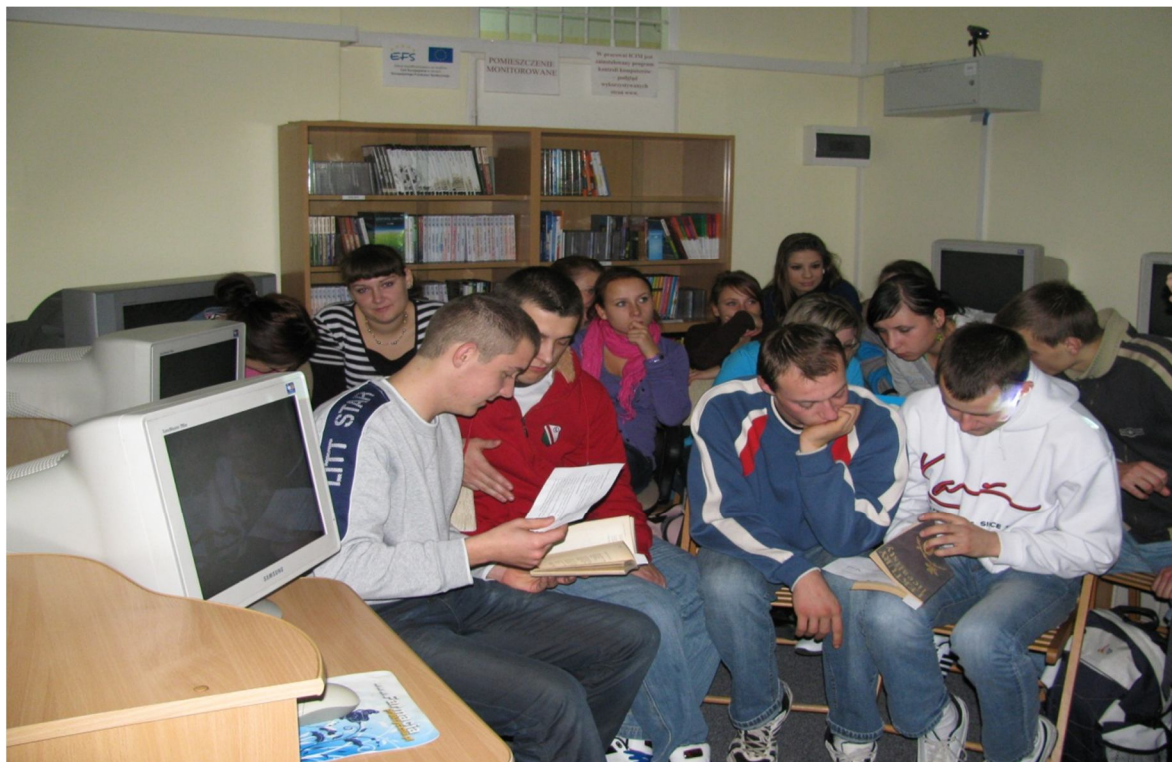
Uczniowie Zespołu Szkół nr 2 im. Oskara Lange w Ciechanowie