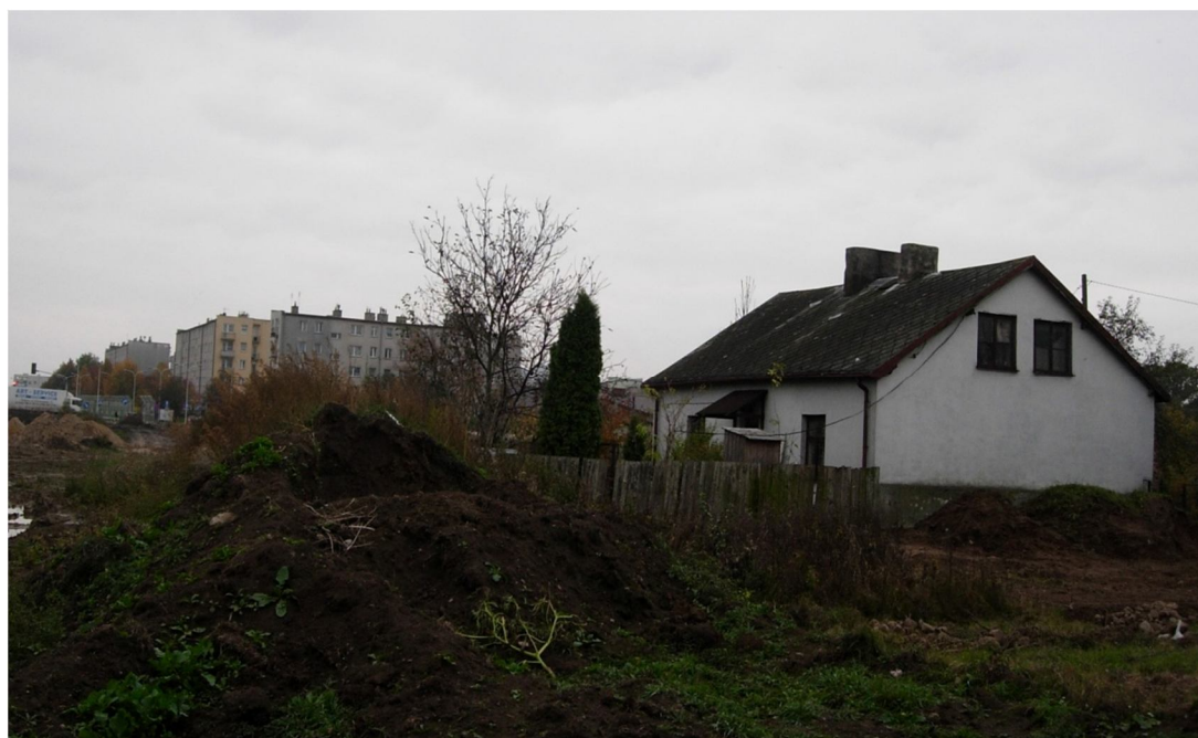
Tzw. dom Walisiewicza przy ul. Zagumiennej, stan z października 2012 r.