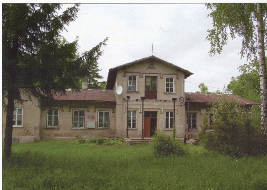
Szulmierz – dwór