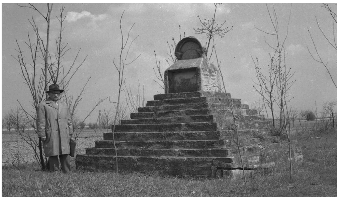
Nieistniejący pomnik na skraju cmentarza, w oddali widoczna ul. Pułtуска.