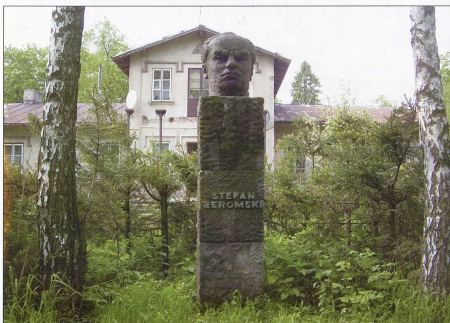
Szulmierz – pomnik S. Żeromskiego